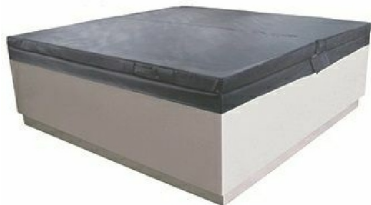
RK5135: Copertura termica per Quadrat free standing / Thermo insulation cover for free standing Quadrat pool.

9S4TWGRS-TRM Proposto con / Proposed with