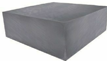
RK5148: Copertura leggera per Quadrat free standing / Light cover for free standing Quadrat pool.